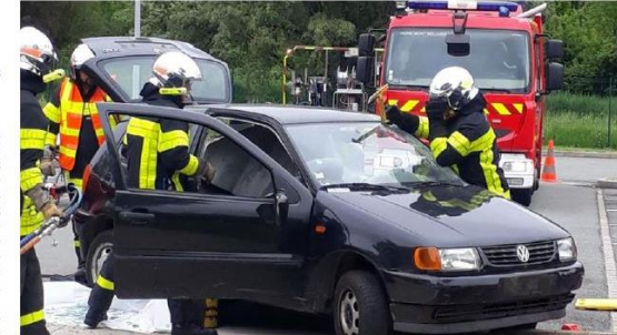
Démonstration d'une désincarcération avec les sapeurs-pompiers de Montbéliard. Instant « choc » pour interpeller les consciences.

A l'image des salariés d'Enedis Alsace et Franche-Comté sensibilisés aux différents risques de la route sur le site Enedis, rue Jacques-Foillet à Montbéliard. Cette rencontre s'est déclinée autour d'une action de sensibilisation au risque routier, en ville, sur autoroute, lors d'un trajet quotidien (domicile-travail) ou d'un déplacement occasionnel. Des prises de risques qui se démultiplient dès lors où la conduite se conjugue avec télépho-