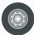
ROUE DE SECOURS OU KIT ANTI-CREVAISON